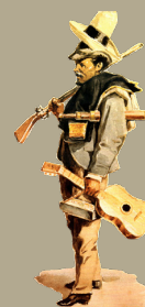
Gráfico de la portada: Piano preparado / Atharip Libre. Quito, 2019. Cedido por su autor para esta publicación.

Esta publicación cuenta con el respaldo del Archivo Equinoccial de Música Ecuatoriana (AEQ) y de la Corporación Musicológica Ecuatoriana CONMÚSICA.