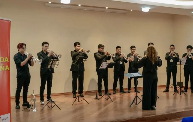
Ensamble de Trompetas UCE. Concierto de Apertura en el Encuentro y Seminario Internacional de Trompeta. Centro Español. Quito, 17 de noviembre 2025.