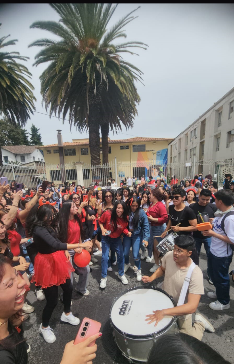
Ensamble popular con estudiantes de la Carrera de Artes Musicales que participaron en el desfile cultural de la Facultad de Filosofía, Letras y Ciencias de la Educación. Quito, 4 diciembre, 2025.