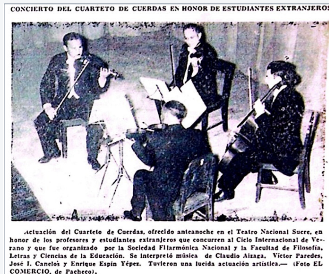
Figura 13. Cuarteto de cuerdas. El Comercio , 23 agosto, 1958.