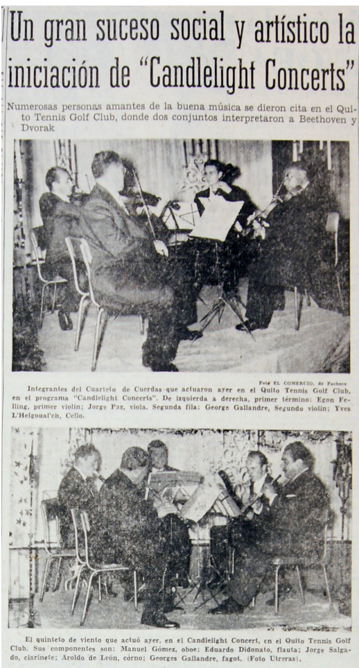
Figura 16. Cuarteto de cuerdas. El Comercio , 17 junio, 1959