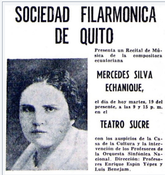
Figura 12. Recital de música ecuatoriana. El Comercio , 19 agosto, 1958.