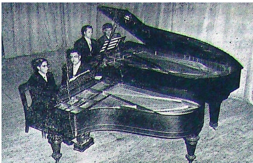
Figura 15. Recital de piano. El Comercio , 18 julio, 1958.

En el Teatro Sucre, se ofreció un concierto de Música de Cámara y canto, por la finalización de cursos, con la participación de destacados profesores del plantel y sus alumnos. Fue un acto de alta categoría artística..