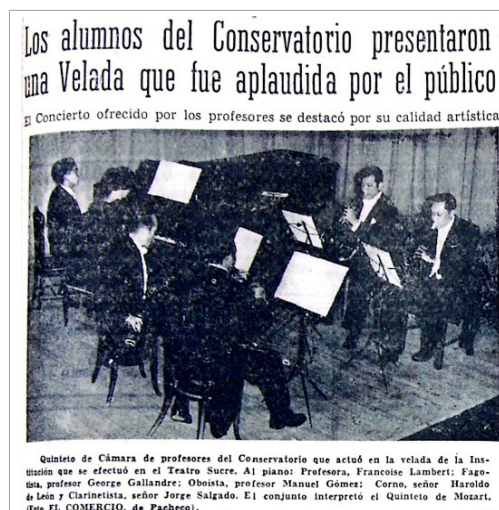
Figura 9. Quinteto del CNM. El Comercio , 20 julio 1958.