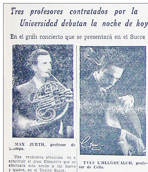
Figura 7. Profesores del CNM. El Comercio , 31 mayo, 1957