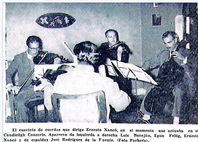
Figura 14. Cuarteto de cuerdas. El Comercio , 2 junio, 1958.