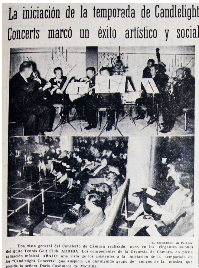
Figura 18. Concierto de cámara. El Comercio , 10 febrero, 1960.