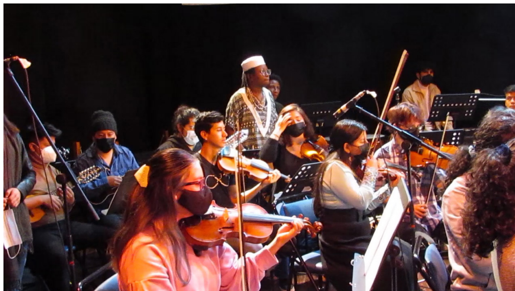
Fig. 1. Orquesta Independencia de la Carrera de Artes Musicales. Quito, mayo, 2022.

Contribuyendo con la numerosa y variada oferta de programaciones conmemorativas del bicentenario de la Batalla del Pichincha, la Facultad de Artes de la Universidad Central del Ecuador (FAUCE) concretamente las carreras de Artes Musicales, Danza, Artes Plásticas y Artes Escénicas, presentaron el evento titulado Manuela y Simón: música de cuando Quito se declaró libre , en función única realizada en el Teatro Nacional de la Casa de las Culturas el 24 de Mayo del 2022.