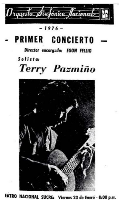
Figura 9. Programa de mano 23 de enero 1976.

El 8 y 9 de abril de 1983, el guitarrista argentino Miguel Ángel Girollet ejecuta el Concierto de la mayor para guitarra y orquesta de Mauro Giuliani y el Concierto de guitarra de Mario Castelnuovo-Tedesco, bajo la batuta de Gerald Brown. El 14 y 15 de abril, Girollet interpreta el Concierto de Aranjuez de Joaquín Rodrigo, cuyos conciertos están patrocinados