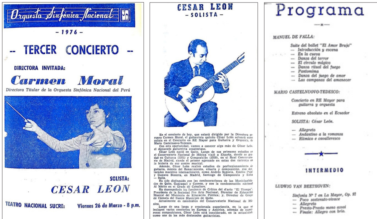
Figura 10. Programa de mano 26 de marzo de 1976

por la Embajada de Argentina y se llevan a cabo en el Teatro Nacional Sucre, Salón del Ministerio de Relaciones Exteriores y en la Catedral Metropolitana respectivamente.