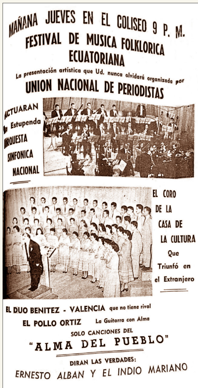
Fig. 5. Artículo promocional de El Comercio del 26 de octubre de 1961.

Los conciertos, de 1956 hasta 1960, denominados “populares” estuvieron pensados en generar un acercamiento hacia un nuevo público a través de repertorio académico occidental. Las circunstancias culturales, falta de políticas educativas hacia el cultivo y aprecio del arte musical académico, de los años 50s no fue favorable para que se produzca este nexo entre una cultura musical poco conocida que empezaba a mostrarse en la sociedad ecuatoriana y quiteña. Por otra parte, la inclusión de un repertorio de música popular en versiones sinfónicas y la participación de artistas populares reconocidos, en los conciertos denominados populares desde 1961, fue una estrategia que tuvo gran acogida y a través de estos conciertos, la gente empezó a tener un acercamiento a la actividad de la orquesta.