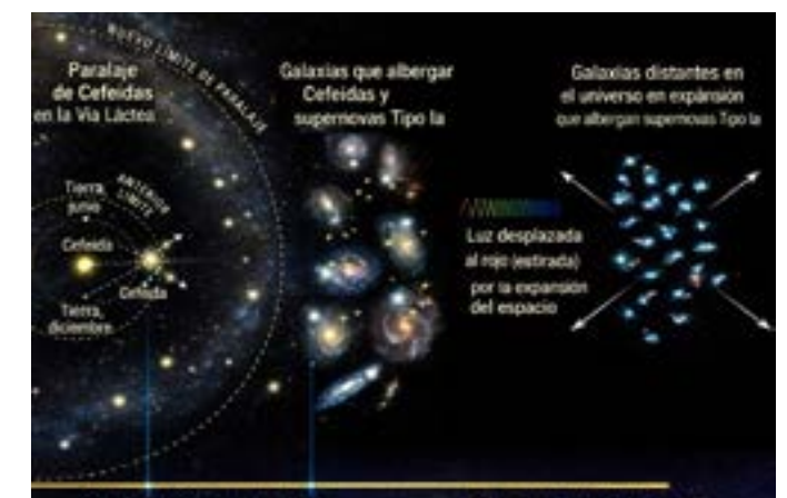
Figura 3: Los tres pasos hacia la constante de Hubble: desde la medición de Cefeidas en la Vía Láctea, pasando por galaxias anfitrionas de supernovas tipo Ia, hasta la observación de galaxias lejanas en expansión. (Hubble Constant and Tension - NASA Science, 2025).

Tal como se muestra en la Figura 3, este procedimiento se conoce como los "tres pasos hacia la constante de Hubble", donde las mediciones locales mediante Cefeidas permiten establecer distancias precisas a galaxias que albergan supernovas tipo Ia, las cuales, a su vez, sirven para extender la escala cósmica hacia galaxias más distantes en la expansión del universo.