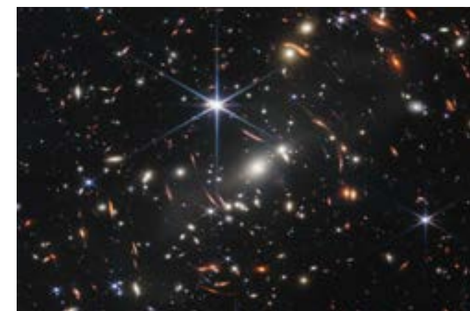
Figura 4: Campo profundo tomado por el telescopio espacial James Webb (JWST). Considerada la imagen más nítida y profunda del universo primitivo hasta la fecha, revela galaxias que antes no eran visibles y ayudará a comprender con mayor precisión la expansión cósmica (NASA Science, 2022).

El descubrimiento de la expansión acelerada del universo consolidó el modelo \Lambda CDM (Lambda–Cold Dark Matter) como el marco teórico que mejor describe la evolución cósmica, sin embargo, las recientes observaciones del telescopio espacial James Webb (JWST) han revelado galaxias masivas y sorprendentemente evolucionadas en etapas muy tempranas del universo, lo que plantea nuevos interrogantes sobre los fundamentos de este modelo.