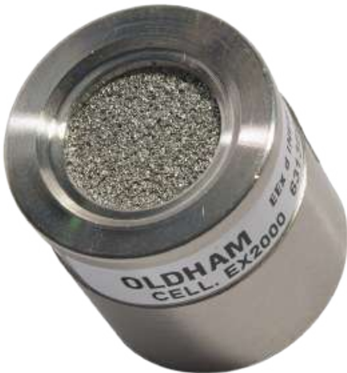
Sensor de gases

Los sensores que detectan gas pueden mejorar su utilidad, depende del material que se utilice para recubrirlos