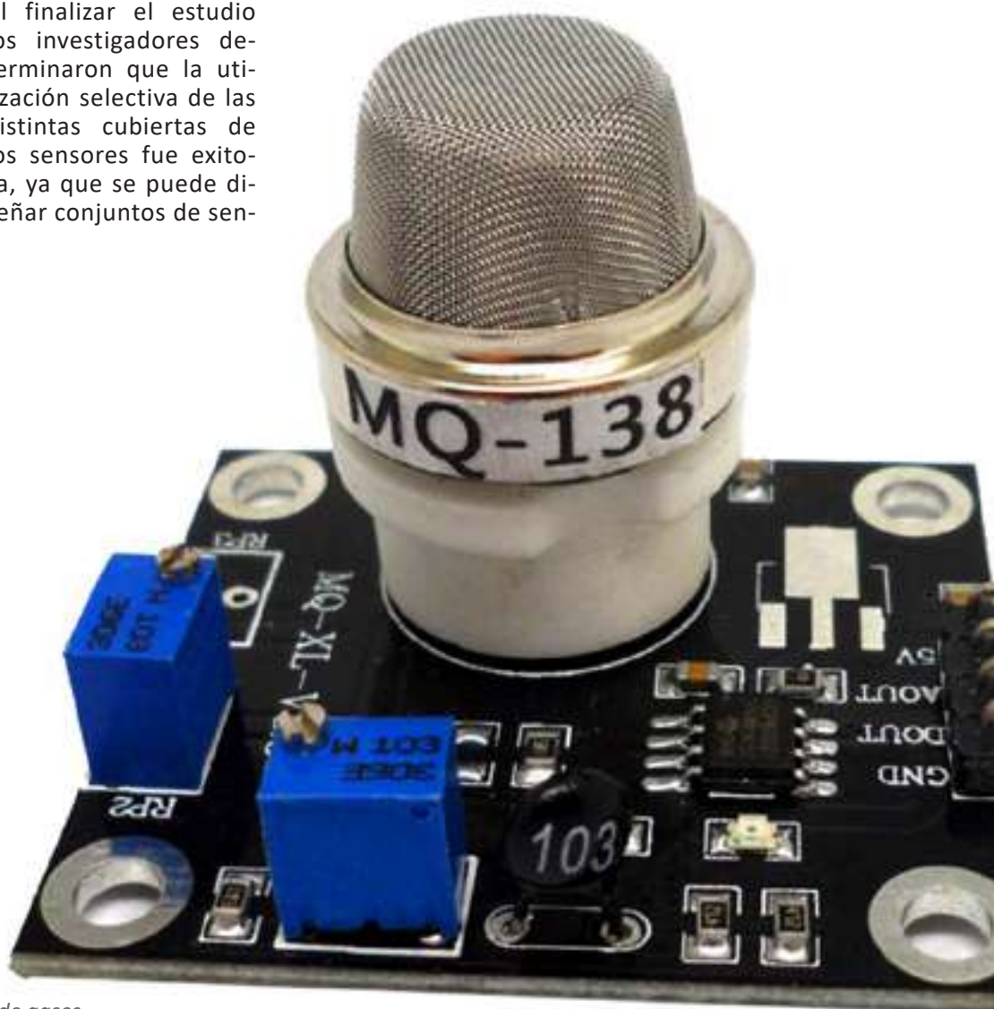
Sensor de gases