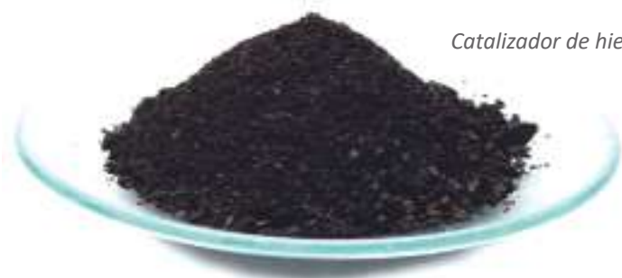
Catalizador de hierro

La petroquímica es la industria que busca de forma permanente alternativas en la baja de los costos de extracción y refinamiento del crudo, esto con la finalidad de evitar que las economías dependientes no sean impactadas con la volatilidad de los precios por barril de petróleo, dado que en estos procesos los catalizadores (elementos que cumplen la función de alterar la velocidad de una reacción química, aumen-