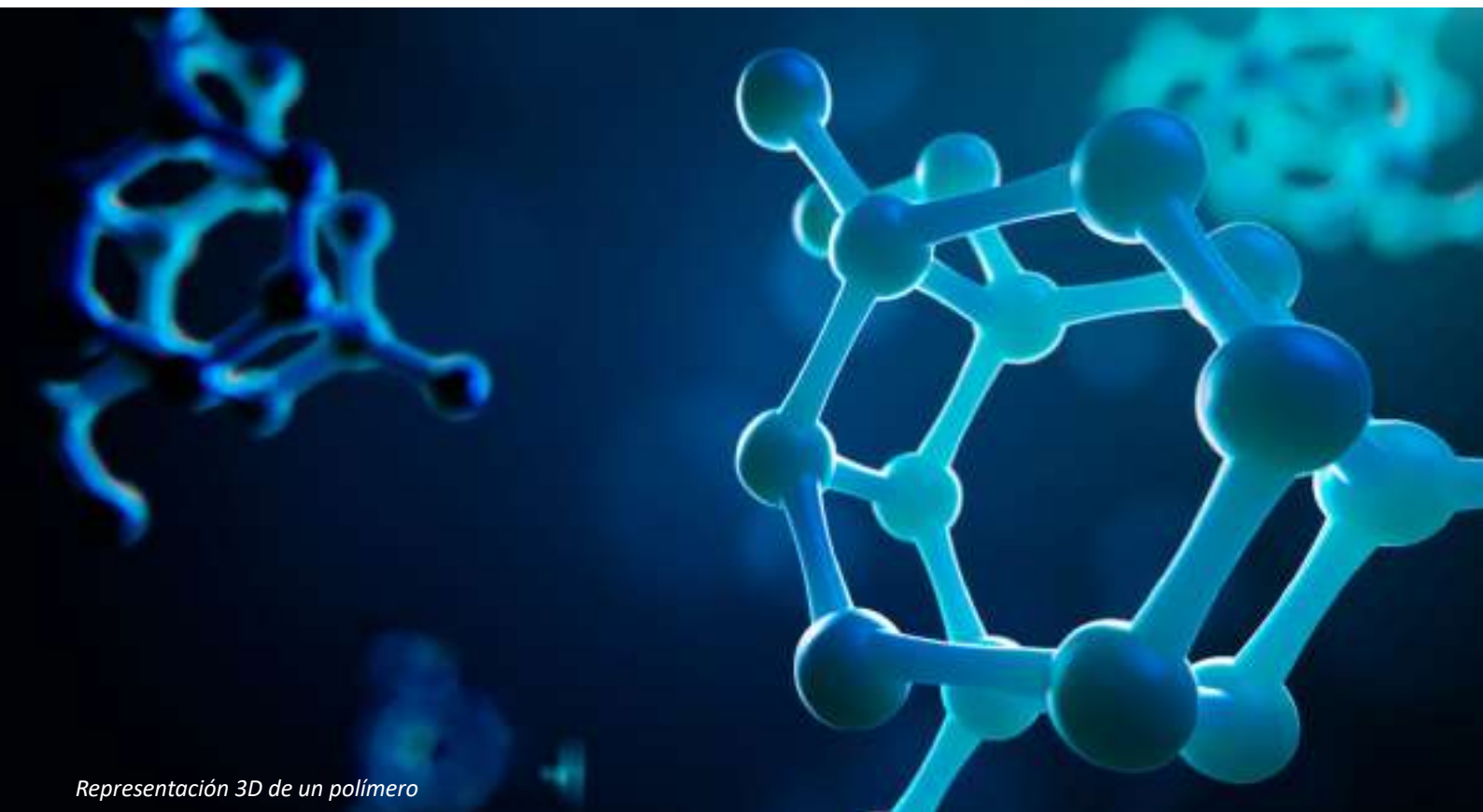
Representación 3D de un polímero

La investigación trató de evidenciar, si esta matriz de sensores permanecía estable du-