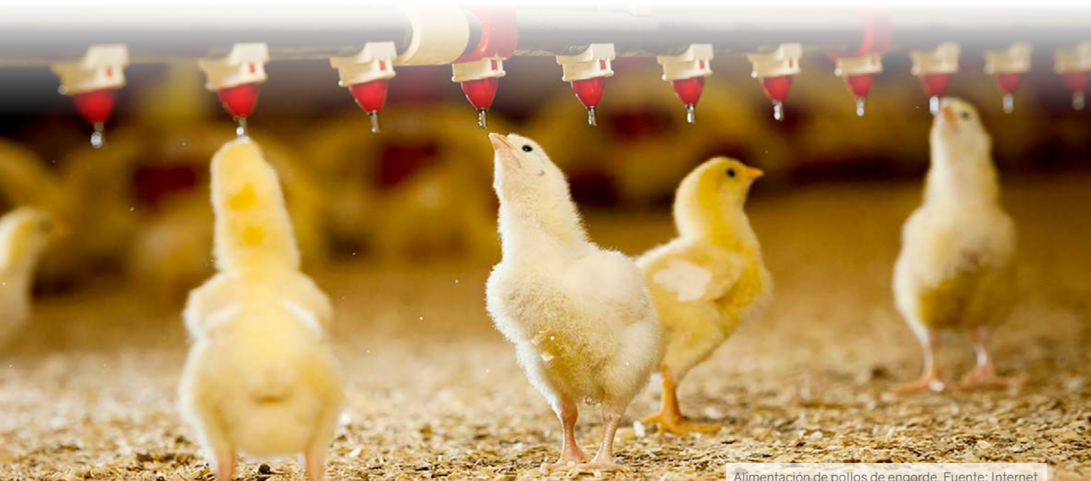
Alimentación de pollos de engorde.

EL USO ADECUADO DE SUPLEMENTOS ALIMENTICIOS EN "BROILERS" (POLLOS DE ENGORDE) DA COMO RESULTADO CONSECUENCIAS POSITIVAS EN LAS GRANJAS.