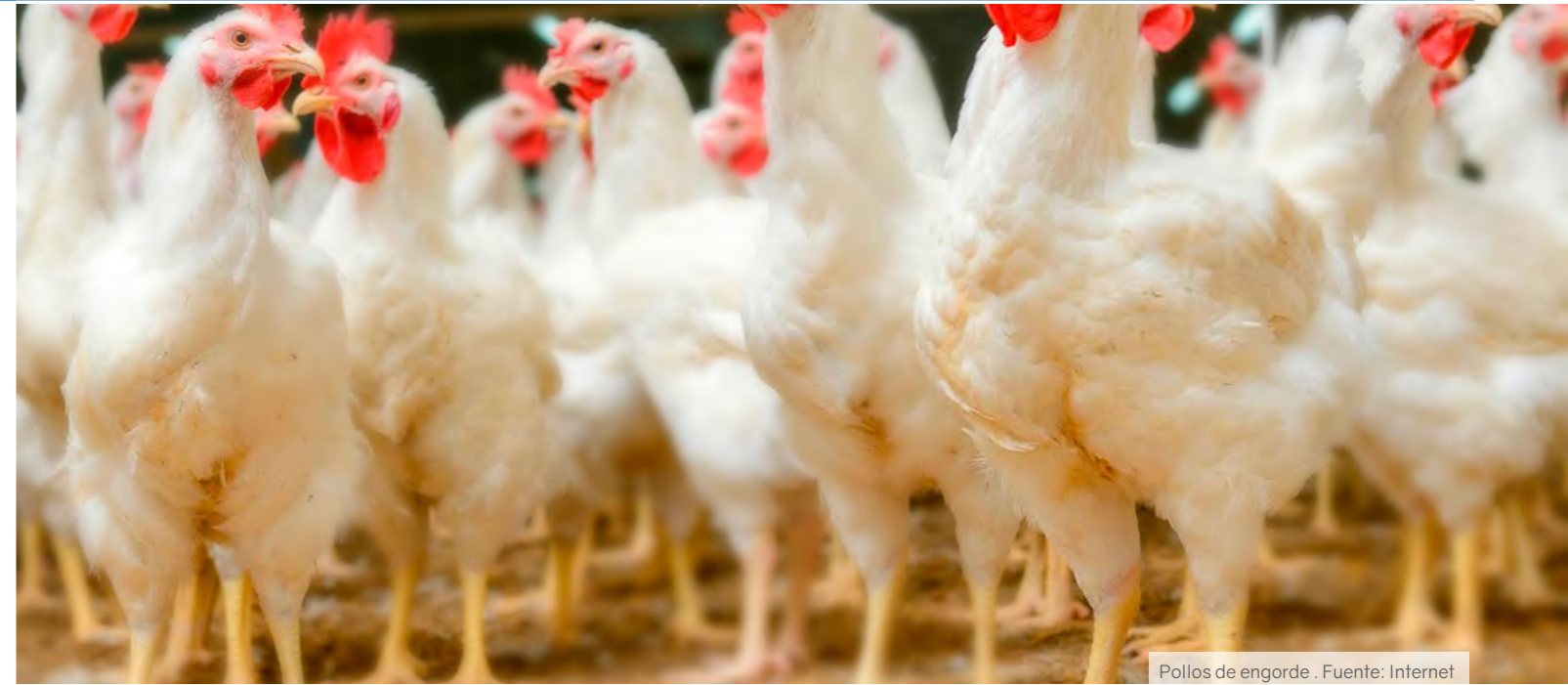
Pollos de engorde.

El mejoramiento en la alimentación de pollos permite un mayor nivel de productividad