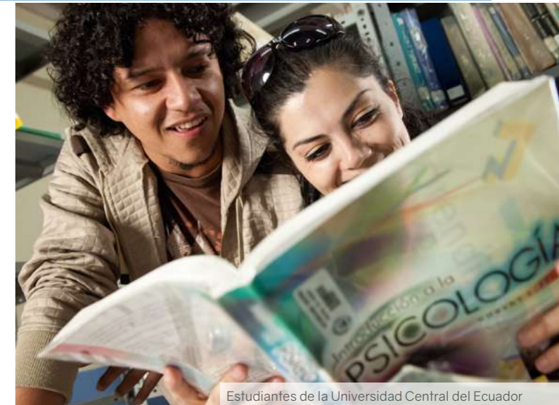
Estudiantes de la Universidad Central del Ecuador

A continuación, se determinó si los promedios altos