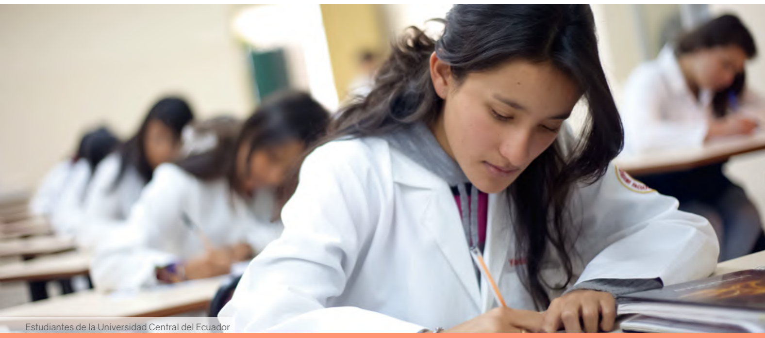
Estudiantes de la Universidad Central del Ecuador

Uno de los factores que influyen en las calificaciones que obtienen los estudiantes es la asistencia a clases.