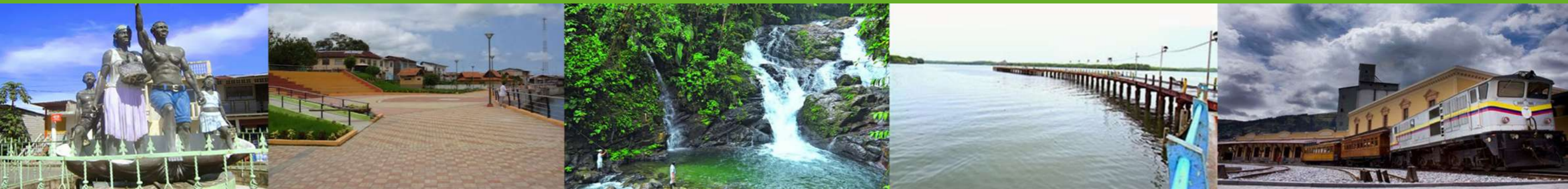
Imágenes de San Lorenzo del Pailón.

El turismo a nivel mundial está considerado como una de las mejores estrategias en el crecimiento comunitario. Una adecuada combinación en el manejo de los recursos de flora y fauna permite a los estados optimizar su potencial e innovar la visión en la promoción de nuevos destinos, incentivando la llegada de más visitantes con el consecuente incremento de los ingresos y la mejora de la calidad de vida de los habitantes. En este sentido el productor turístico debe tomar en cuenta la importancia en aspectos como las prestaciones de servicios y las expectativas de los turistas.