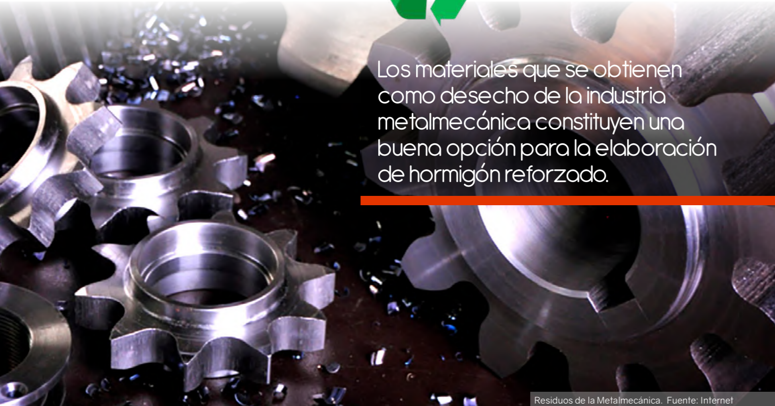
Residuos de la Metalmeccánica.

Los materiales que se obtienen como desecho de la industria metalmeccánica constituyen una buena opción para la elaboración de hormigón reforzado.