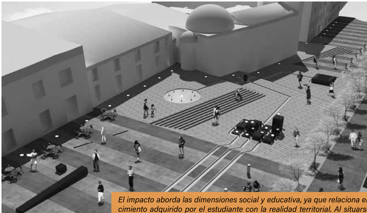
Foto: Segunda intervención para el bulvar, se observa la parte posterior de la Capilla de «El Robo»

El impacto aborda las dimensiones social y educativa, ya que relaciona el conocimiento adquirido por el estudiante con la realidad territorial. Al situarse en la perspectiva del ciudadano que ocupa un determinado espacio urbano, el estudiante puede percibir el espacio público con mayor conocimiento y libertad, lo que le permite apropiarse de él de una manera más creativa.