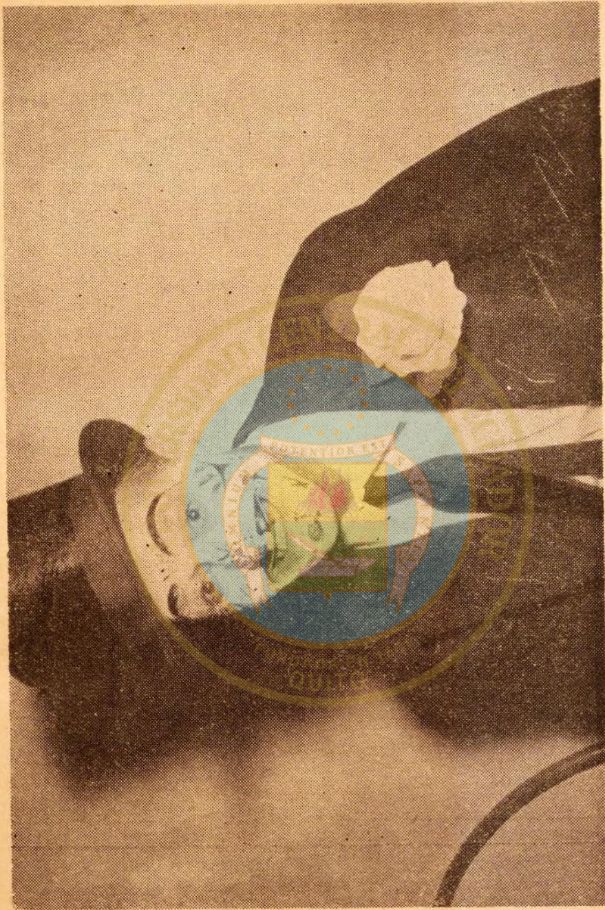
MIMICA DE MURGUISTA