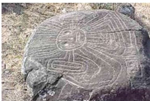
Representación solar en Santo Domingo de Guzmán

Nota. Representación solar en Santo Domingo de Guzmán. Tomado de González Ojeda, 2007.