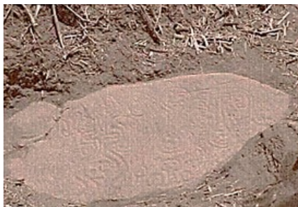
Petroglifo de Yamana

Nota: Petroglifo de Yamana. Tomado de González Ojeda, 2007.