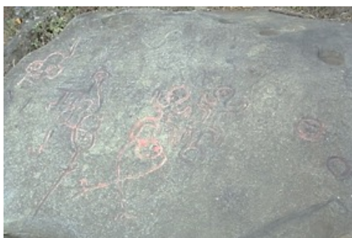
Petroglifo de Numbiaranga

Nota. Petroglifo de Numbiaranga, Macará.