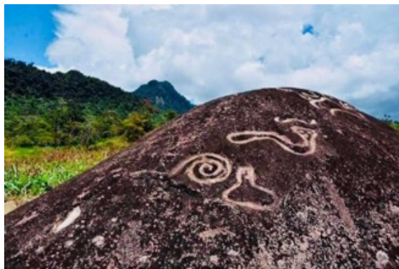
Complejo Arqueológico “El Catazho”

Nota. Arte mediante petroglifos en el cerro Catazho.