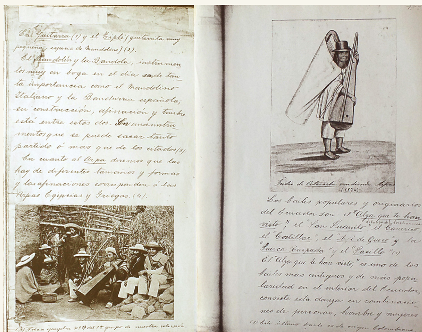
Páginas del libro manuscrito El Arte en América de Pedro Pablo Traversari.

trae además ejemplos pautados. A estas pioneras historias generales, seguiría la de Sixto M. Durán: Música ecuatoriana , 1928, que podría decirse son en conjunto el prelude de la musicología ecuatoriana, disciplina que va tomando cuerpo a partir del resumen de Segundo Luis Moreno: La música en Ecuador , publicado en 1930.