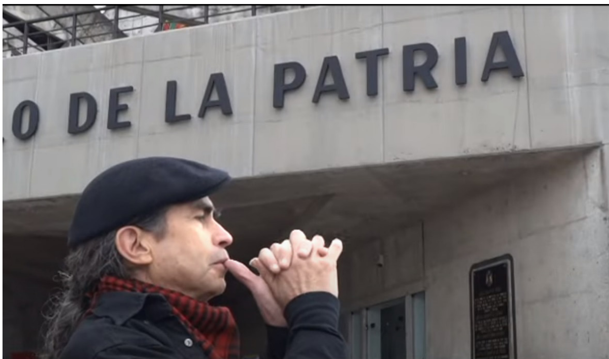
Figura 1: Jaime Guevara en el video de la parodia Patria https://www.youtube.com/watch?v=u4a4PdYkFjo

de policía. Los estudiantes de secundaria que protestaron fueron amenazados con la expulsión de sus escuelas y muchos organizadores de las protestas fueron localizados por el gobierno y recibieron diversos tipos de amenazas por sus acciones 1 . El pueblo ecuatoriano vio que el gobierno violaba la ley constitucional y se les arrebató su derecho a protestar.