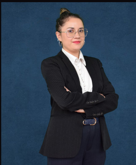
Quito, 2024.